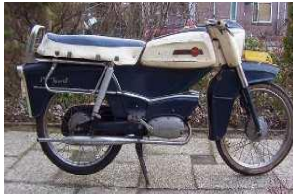
Berini F 71

Vanaf die tijd maakte ze van het zelfde frame en wat aanpassingen verschillende modellen zoals de Jeunesse een bromfiets die nu nog een mooie uitstraling heeft met zijn dubbele uitlaat met megafoon, de uitsparing in de tank voor je knie, een laag stuur en een korte buddyseat en verkrijgbaar in twee en drie versnellingen voor maar 698 gulden 2 vers. En 718 gulden 3 vers. Wat dacht u van de Berini Junior het lijkt net een Italiaans model een plaatje om te zien.