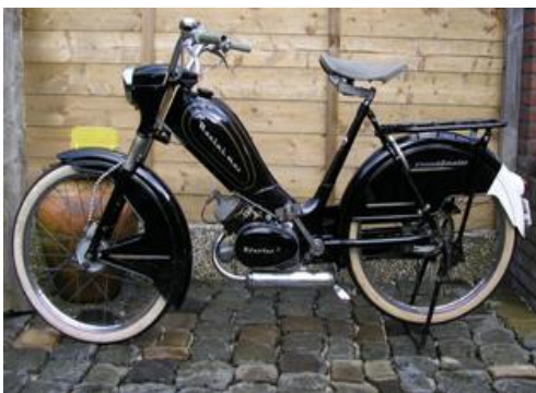
M21 de luxe kort model