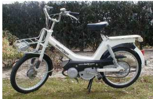
Berini van Gazelle

Wij hopen dat met dit verhaal de Berini toch maar weer de aandacht verdient die een Hollandse bromfiets hoort te krijgen.