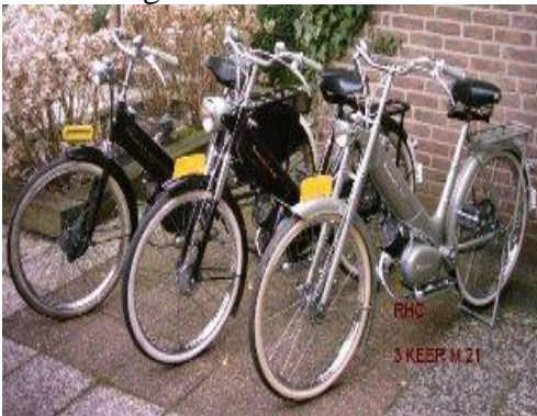
3 x M 21

In 1955 kwam er ook nog een twee versnellings brommer uit genaamd M22 maar dit was een mislukking.