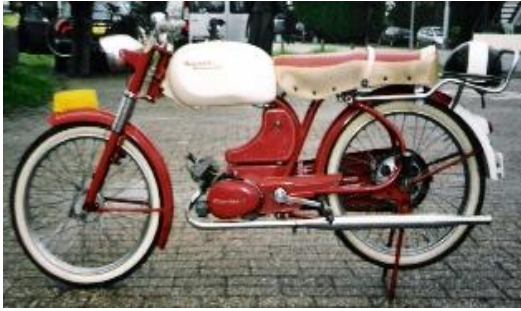
Berini M21 sport