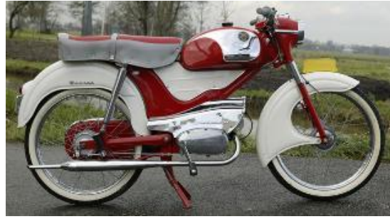
Berini M35 sport