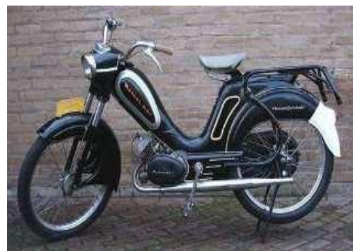
M23 de luxe Lang model

De M 23 kwam in 1957 op de weg deze bromfiets werd aangedreven met rol op het achterwiel